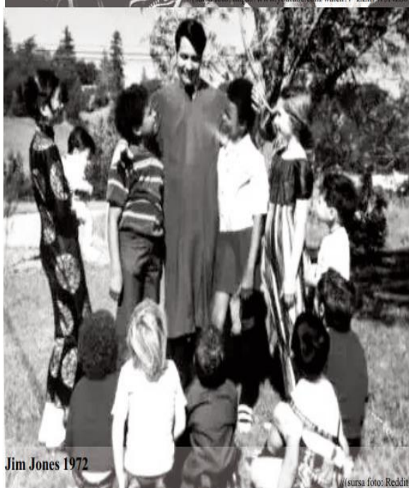
Jim Jones 1972