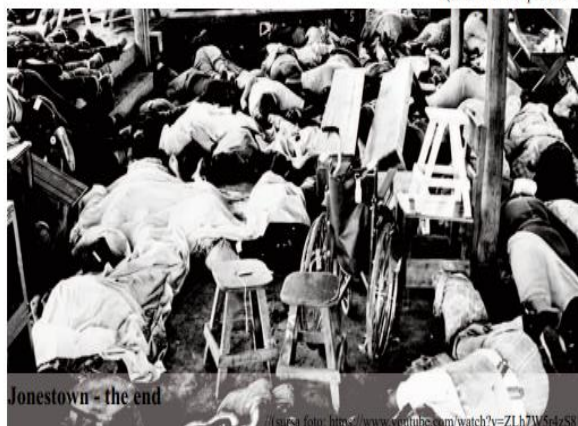
Jonestown - the end